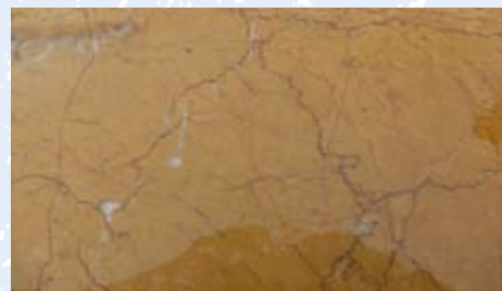
brèche jaune de Pourcieux

Il est paradoxal de constater que l'activité des carrières qui a longtemps été florissante jadis sur la commune n'a pas laissé de traces importantes dans la mémoire collective du village. Les Amis de la Pierre sont donc intéressés par le recueil d'anecdotes où les souvenirs éventuels recueillis par les proches des anciens travailleurs qui étaient bien souvent d'origine italienne. Tel : 04 94 72 53 83.